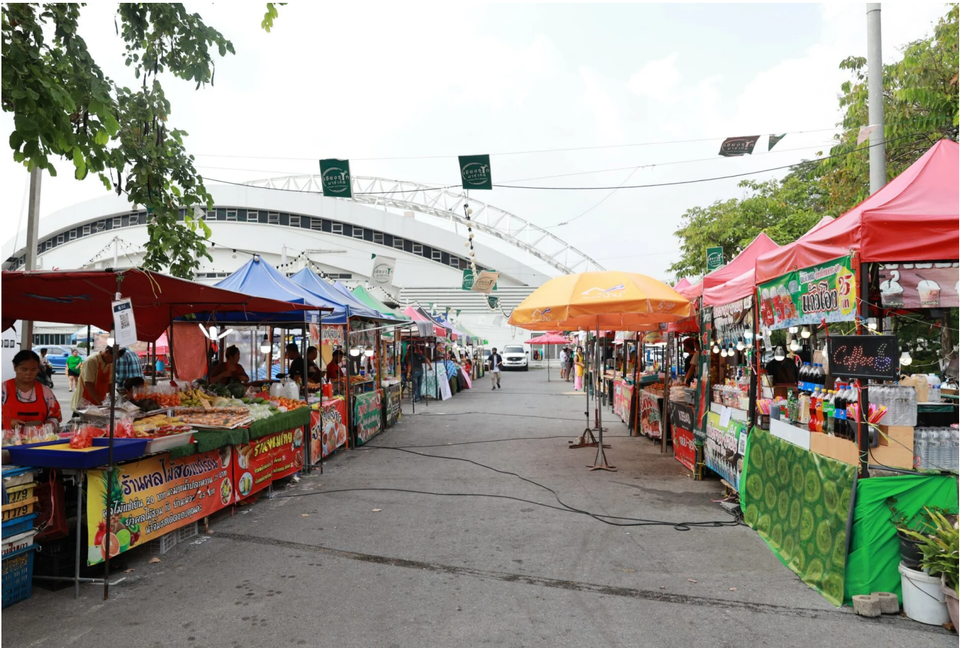
( https://storage-wp.thaipost.net/2023/04/140A7894.jpg )