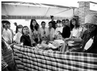
อาจารย์โชว์ความงดงามผ้าบ้านหนองลิง