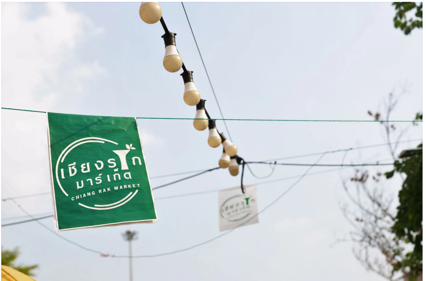
( https://storage-wp.thaipost.net/2023/04/140A7884.jpg )