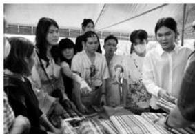
เลือกผ้าที่จะใช้ออกแบบ