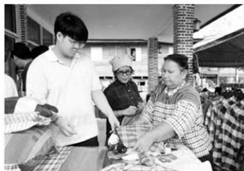
บำแต่ว ไชวสินค้านำราคา สำหรับตกแต่งบ้าน