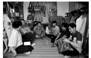
นักศึกษา DBTM ร่วมกันวางแผนการตลาดกับชุมชน