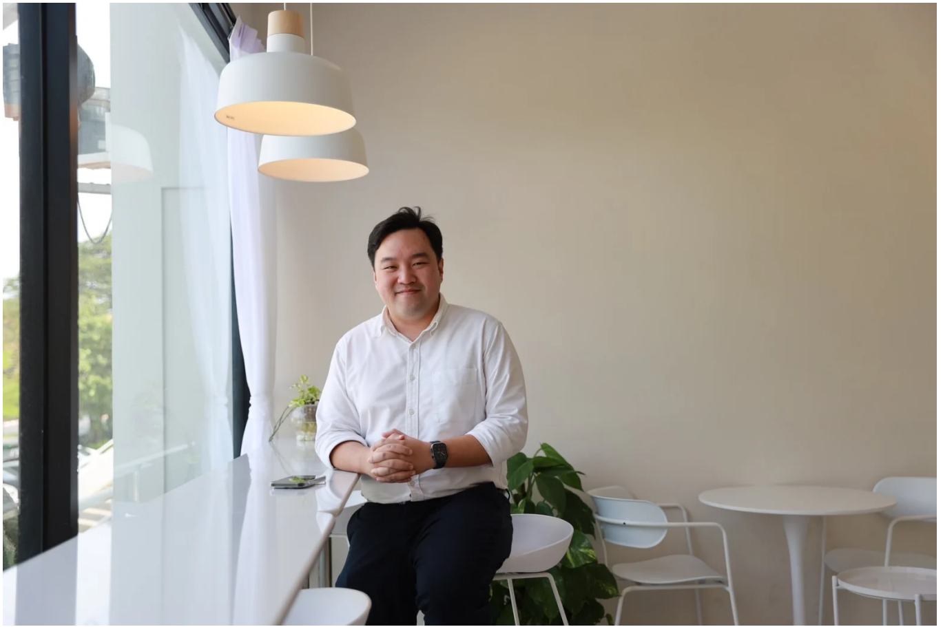
( https://storage-wp.thaipost.net/2023/04/นายภูวดล-ศิริชัยสินธพ.jpg )