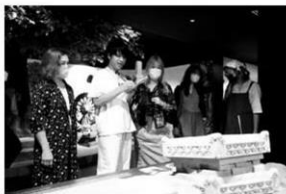
ศึกษาวัฒนธรรมก่อนออกแบบ