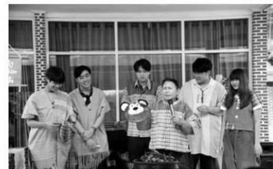
นักศึกษาใส่ชุดของกลุ่มทอผ้าบ้านหนองลิงให้เพื่อนๆ ได้ช่วยแก้ไขการออกแบบให้มีความเป็นวัยรุ่นมากขึ้น