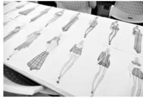
ผลงานการออกแบบชุดของ น้องๆ คณะศิลปกรรมศาสตร์