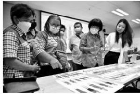
ชุมชนช่วยกันเลือกแบบ