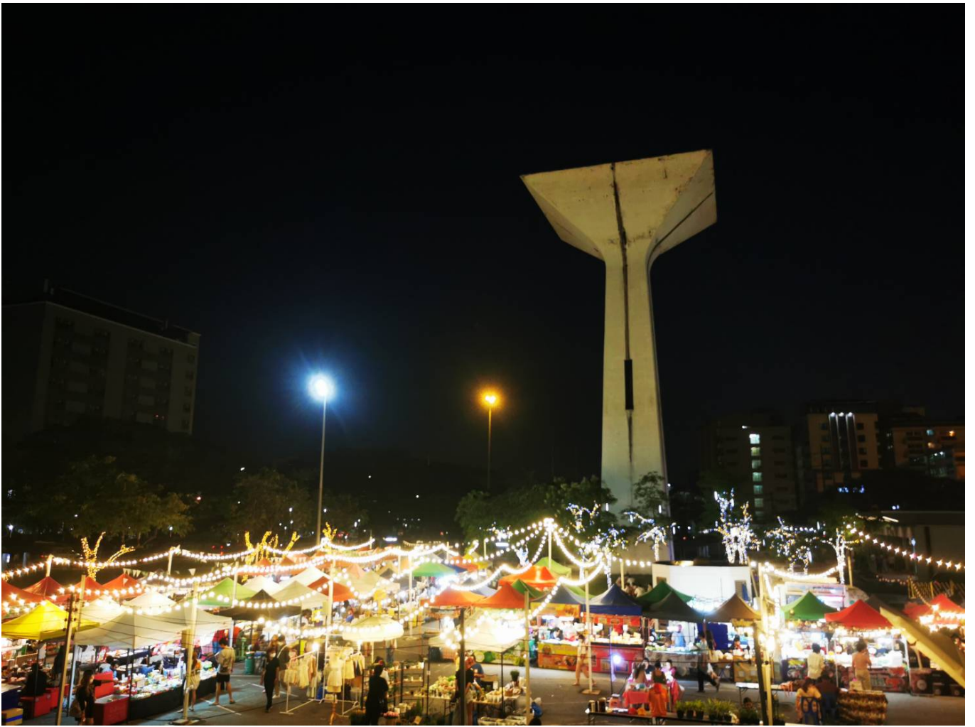
( https://storage-wp.thaipost.net/2023/04/400567.jpg )