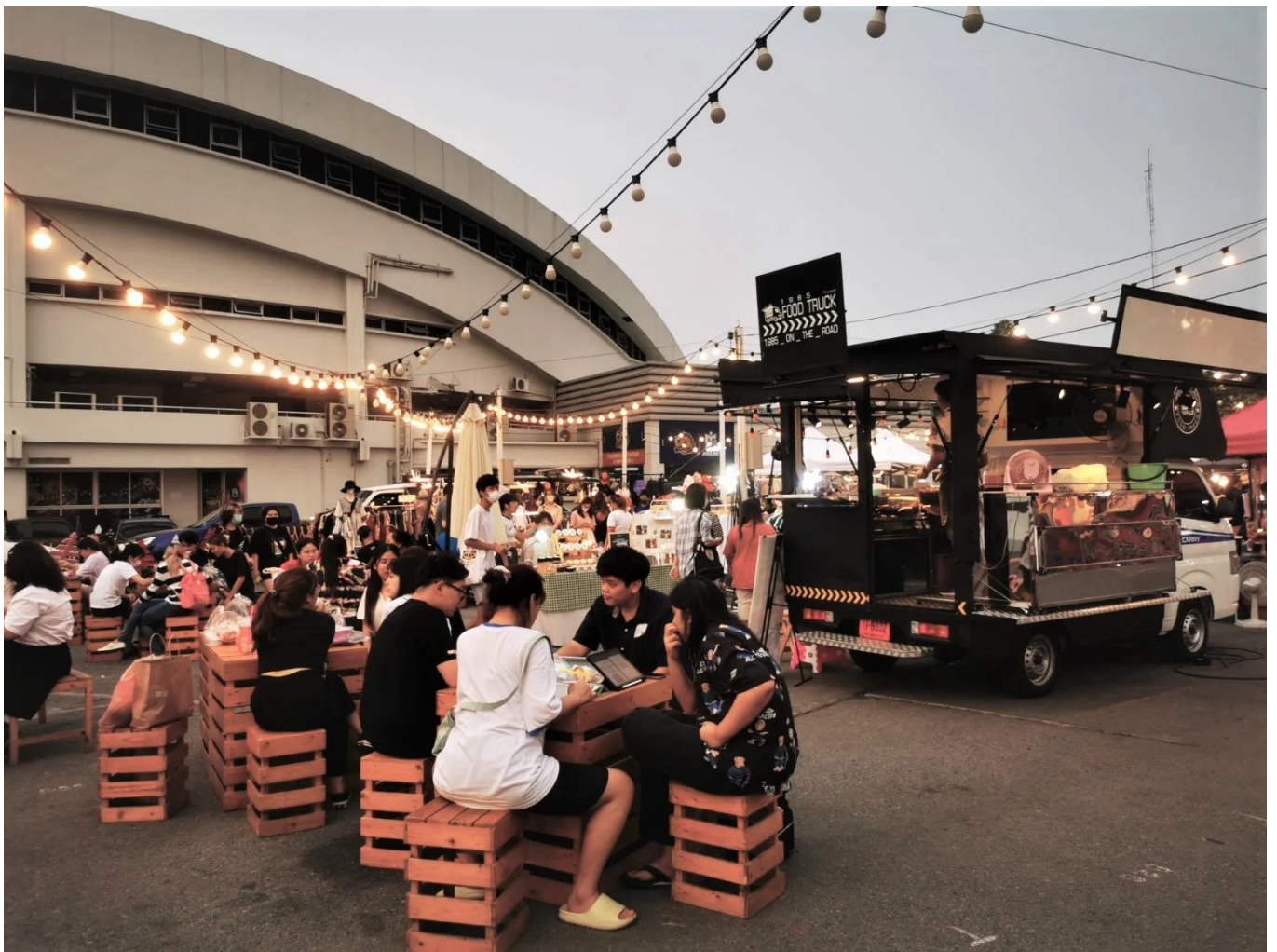
( https://storage-wp.thaipost.net/2023/04/400557.jpg )